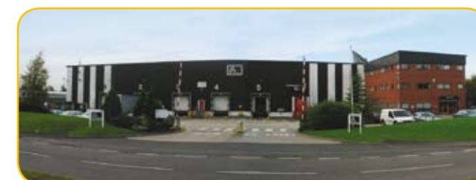
Завод в г. Престон (Великобритания)