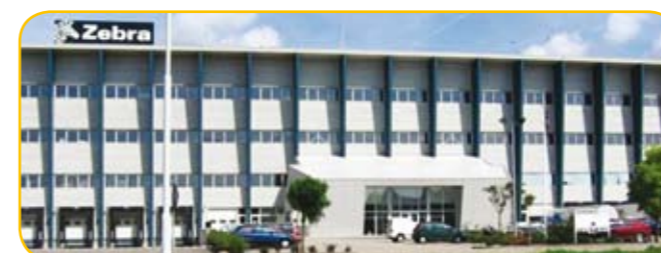
Завод в г. Херенвин (Нидерланды)

Zebra является одним из крупнейших в Европе поставщиков расходных материалов для печати этикеток. Наши предприятия расположены в Великобритании и Нидерландах.